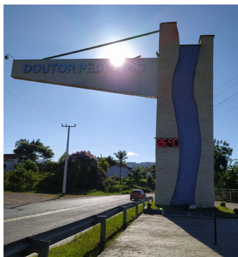
FOTO: Pórtico do Salto Donner