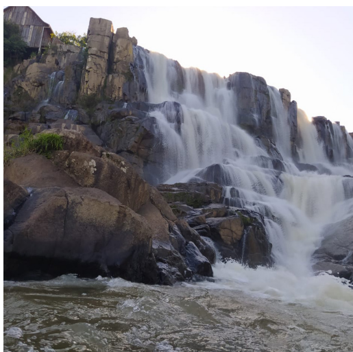
FOTO: Cachoeira Salto Donner